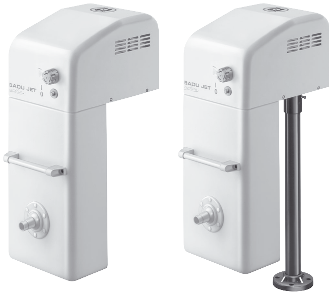
active für FESTRANDBECKEN for inground pools